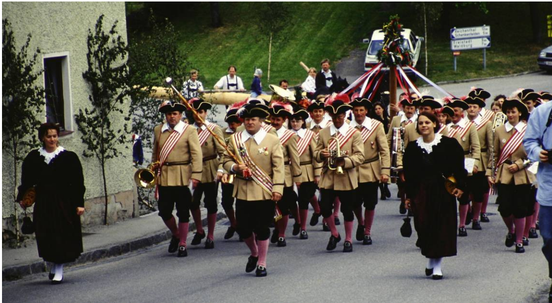
Einzug in Hirschbach mit der Musikkapelle Schenkenfelden

Noch gut in Erinnerung die Vorrichtung in die die „Diebe“ zur Strafe eingespannt und von den Kindern „verhaut“ wurden.