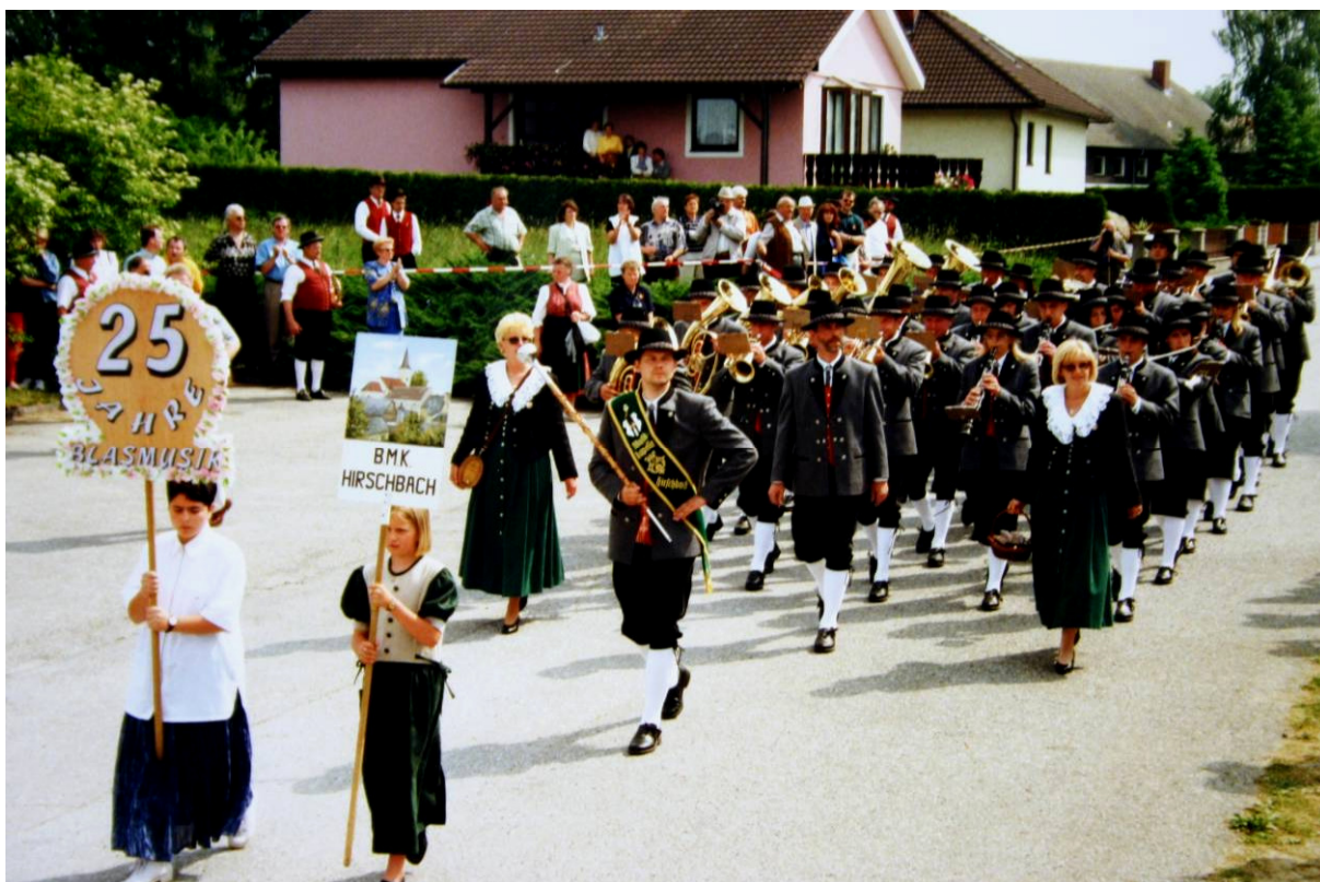
Die Musikkapelle Hirschbach NÖ bei der Marschwertung