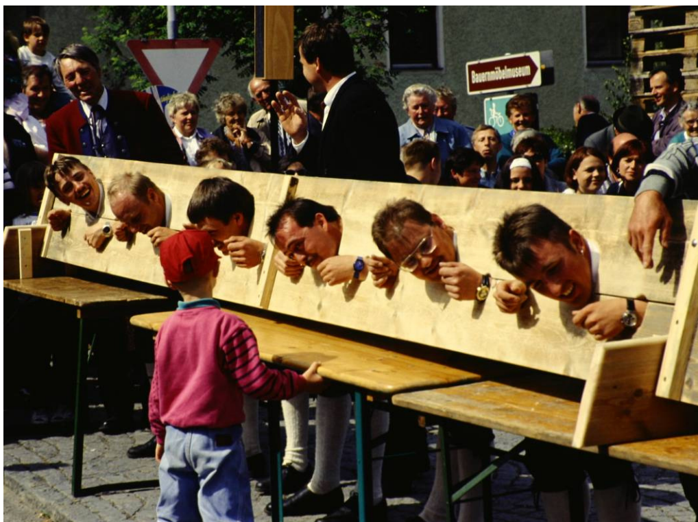
Als Strafe wurden die „Diebe“ eingespannt und von den Kindern „Verhauen“

Nach dem wirklich gelungenem Fest hat sich der Ärger in Wohlgefallen aufgelöst. Auch das finanzielle Ergebnis war gut: pro Verein ATS 21.820,85 Reingewinn. Nach diesem Fest hofften auch die anderen Vereine, die später wieder einen Maibaum aufstellten, auf einen Diebstahl; leider kam es in den nächsten Jahren nicht dazu.