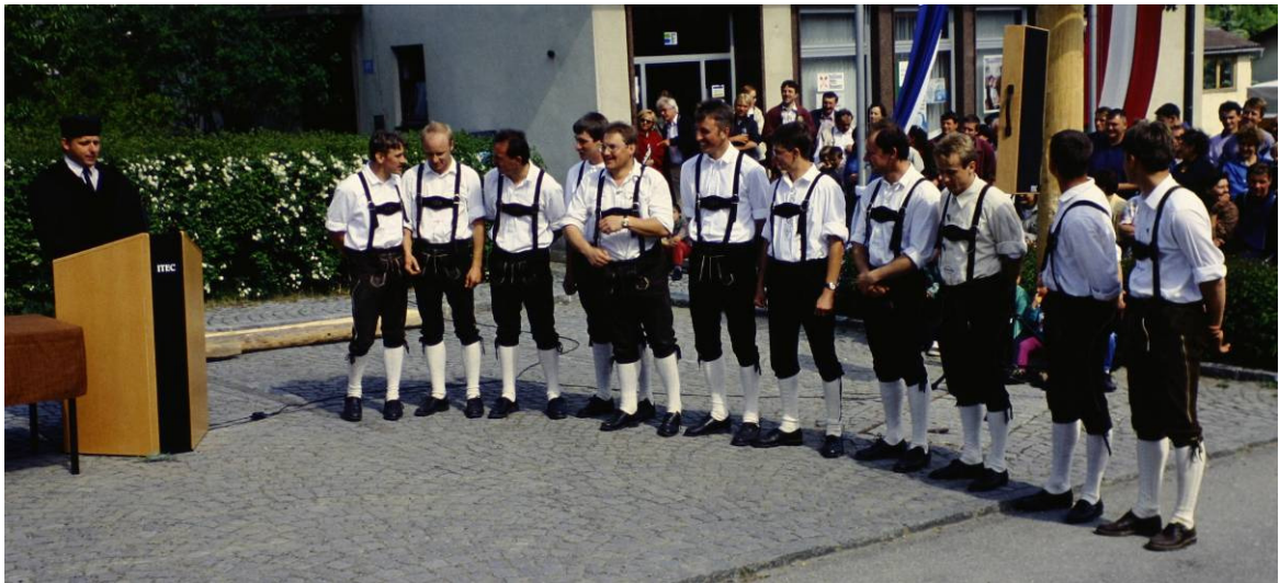
Die Gerichtsverhandlung, bei der die Maibaumdiebe vom Richter „verurteilt“ wurden.