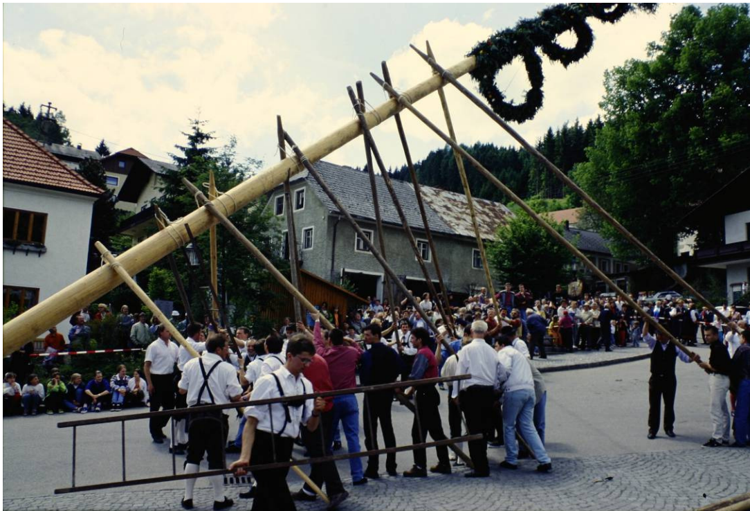
Das Aufstellen des Maibaumes ohne technische Hilfsmittel durch die Landjugend von Schenkenfelden