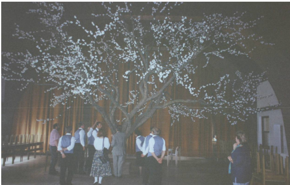
Die Dekoration des Vereinssaales in Hirschbach NÖ: ein in Hirschbach geschlägerter Apfelbaum, der wieder „zusammengebaut“ und mit Papierblüten geschmückt wurde. Der Baum stammt vom „Mayer“ in Pemsedt.