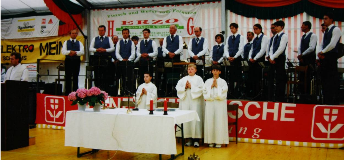
Unsere Musiker bei der Hl. Messe im Festzelt

Gefeiert wurden 25 Jahre Blasmusik in Hirschbach NÖ